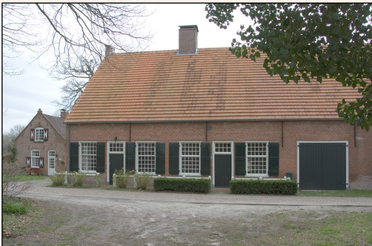
Gezicht op de 'herenboerderij' met links de 'herenkamer' (twee ramen met een deur). Foto Marius Broos, 28 maart 2023.

De schrijfster, die ook op dit punt hare revolutionaire gevoelens en illusies niet prijs geeft en ze zonder schroom verkondigt, zegt er van: