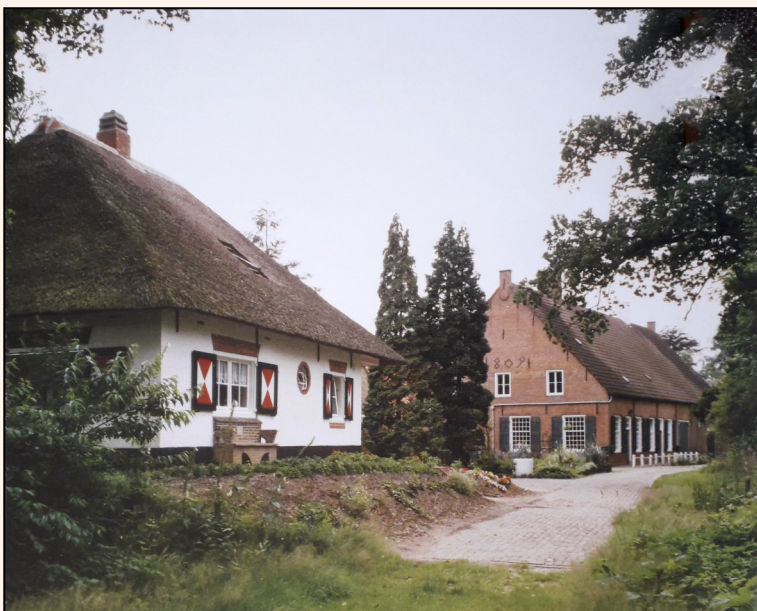
De 'Angora Hoeve' uit 1900 (links) en de 'herenboerderij', gebouwd in 1809. Foto uit circa 1985 (in: 'HRRH').

beleg verklaarde gebied verzocht mede te gaan naar de marechaussee-kazerne voor een onderzoek, voor hetwelk in het station geen gelegenheid bestond. Aan dit verzoek is onmiddellijk gevolg gegeven.