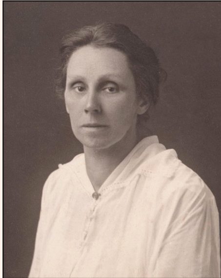
Henriette Roland Holst. Boven: foto, circa 1910. Onder: tekening Michiel de Klerk, 1921 (in: 'HRRH').

Zij huwde in 1896 met beeldend kunstenaar Richard N. Roland Holst en raakte bevriend met de dichter Herman Gorter, die haar aanzette tot het lezen van 'Das Kapital' van Karl Marx. In diezelfde tijd werd ze dan ook politiek actief en begon haar carrière als schrijfster op politiek, historisch en filo-