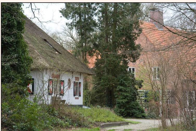
Gezichten op de 'Angorahoeve', boven vanuit het zuidoosten en onder vanuit het noordoosten (en andere gebouwen bij de 'herenboerderij'). Foto's Marius Broos, 28 maart 2023.

ons heeft afgeschilderd, sterkt ons in de meening, dat het zoo ver niet komen zal.