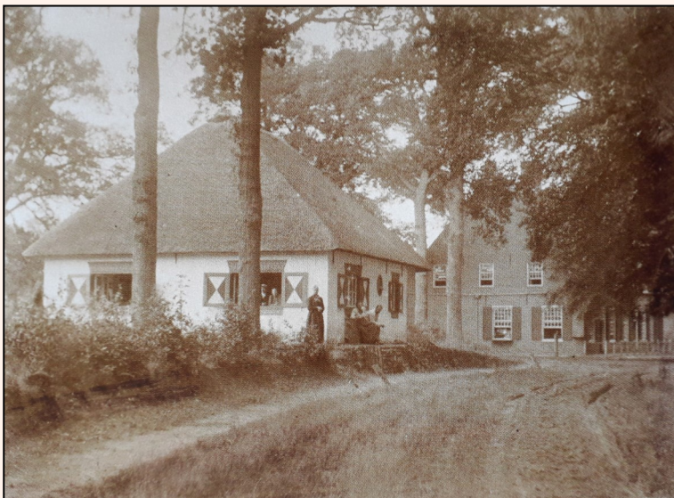
In 1900 werd naar het ontwerp van Richard Roland Holst de 'Angora Hoeve' (kortweg 'de hoeve') neergezet naast de statige boerderij uit 1809 met een 'herenkamer'. Het was een 'romantisch' wit landhuisje onder een rieten kap in Gooise stijl. Foto uit circa 1908 (in: 'HRRH').